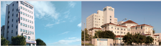
HOLLYWOOD PRESBYTERIAN MEDICAL CENTER